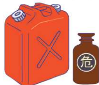
可燃性液体(灯油・ガソリンなど)・酸類・毒物など