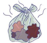
不潔なもの・臭気を発するもの