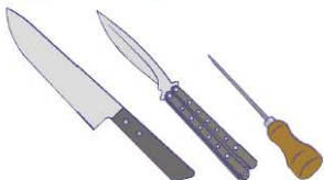
梱包されていない刃物・鋭利なものなど

他のお客さまに危害を及ぼすおそれのあるもの、車両を破損するおそれのあるものなどは車内への持ち込みはできません。