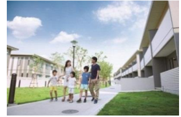
▲ハーモニック レジデンス シラチャ