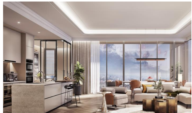
▲リビング（3ベッドルーム）