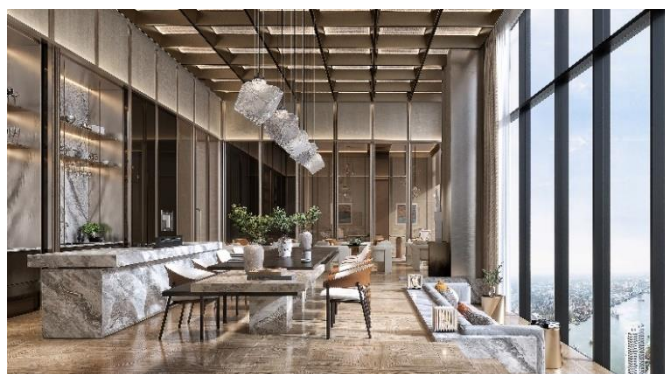
▲共用キッチンスペース