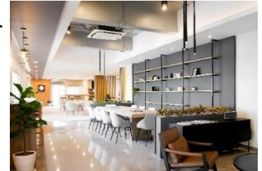
▲グリーンライフ シラチャ