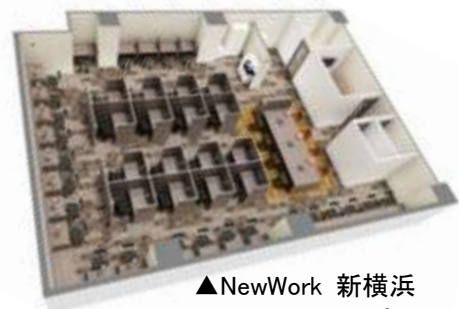
▲NewWork 新横浜 以 上