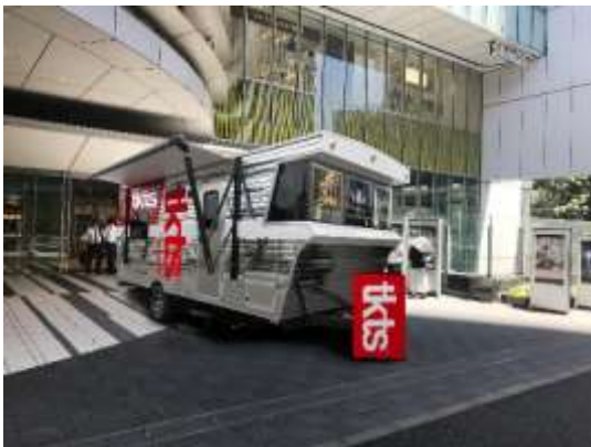
▲TKTS 渋谷@渋谷ヒカリエ

ロングランプランニング株式会社（東京都新宿区、以下:ロングランプランニング）は、NY ブロードウェイ発祥のディスカウントチケットストア「TKTS(ティーケーティーエス)」の旗艦店（以下:旗艦店）を、2019年8月29日（木）から「渋谷ヒカリエ」に、9月5日（木）から南海ターミナルビルの「総合インフォメーションセンターなんば」内に、それぞれ東京急行電鉄株式会社（東京都渋谷区、以下:東急電鉄）、南海電気鉄道株式会社（大阪府大阪市、以下:南海電鉄）の協力のもと、オープンいたします。