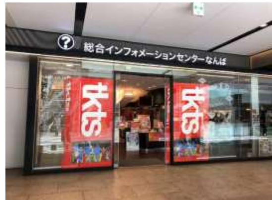
▲TKTS なんば@南海ターミナルビル内