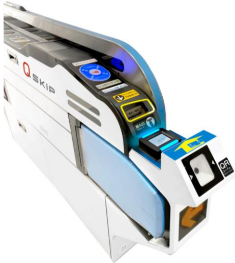
◀「クレジットカードのタッチ機能」および「QRコード」に対応した改札機

(「クレジットカードのタッチ機能」および「QRコード」に対応した改札機を各改札に1台整備)