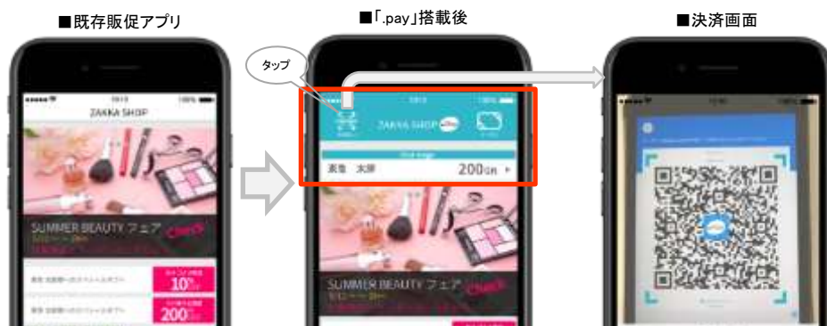
▲クレジット決済ソリューション「.pay」組み込みイメージ

東急電鉄は、今後、カード決済ネットワーク最大手の NTT データとともに、東急カード株式会社のクレジット業務、株式会社東急エージェンシーのマーケティング業務などのノウハウを活用して、決済手段の発展を支え、「日本一住みたい沿線 東急沿線」の実現や、日本全国の人びとの生活をより便利にしていくことを目指します。本ソリューションの詳細は別紙のとおりです。