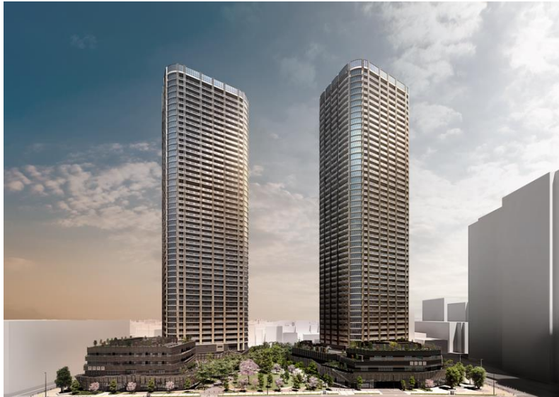
▲ザ・パークハウス 武蔵小杉 Towers 西側外観完成予想 CG

三菱地所レジデンス株式会社、東京建物株式会社、東急株式会社、東急不動産株式会社の4社は、武蔵小杉駅北側エリアの「まち一体型複合開発」における、武蔵小杉最大級2棟1,438戸（サウス719戸、ノース719戸）の地上50階建、免震タワーレジデンス「ザ・パークハウス 武蔵小杉 Towers」（以下、「本物件」）の概要を発表します。また、本物件の魅力を紹介する特設サイトを公開し、タワーレジデンスの新しい暮らし方を提案していきます。