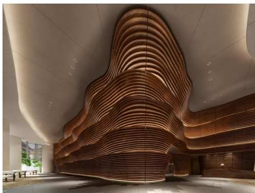
▲グランドエントランス（サウス）完成予想 CG

吹き抜け空間のグランドエントランスは、「サウス」・「ノース」2棟のタワーレジデンス、それぞれテーマの異なるデザインウォールがお出迎えます。サウスのテーマは「躍動」——暮らしを愉しむダイナミズムを描きます。ノースのテーマは「律動」——暮らしを支える規則正しいリズムを描きます。どちらもリズムを刻むように心地よく配列された年輪からは、安らぎや自然の奥行きを身近に感じることができます。