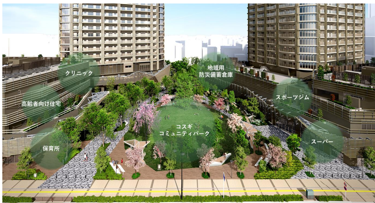
▲施設全体 完成予想 CG

本物件の特長である「まち一体型複合開発」により、入居者が自らのライフステージに応じて、自己の健康増進や子育て、高齢福祉サービスを受けることが可能になり、多様な世代の人々が、生涯にわたって安心して豊かに暮らし続けるための環境を備えました。また、地域に開かれた空間づくりにより、自然を感じ安心できる空間と交流の場を設け、昔からある住宅街の穏やかな暮らしとタワーレジデンスの先進的な暮らしが調和することで、新しい暮らし方を提案いたします。