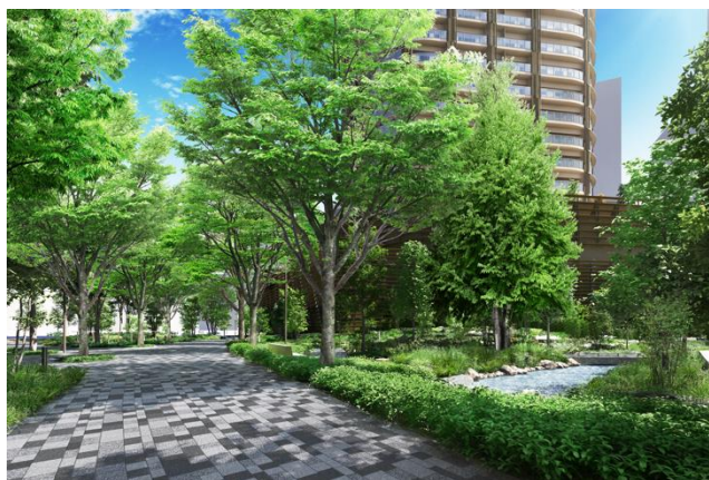
▲コスギプロムナード 完成予想 CG