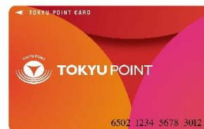
▲TOKYU POINT CARD