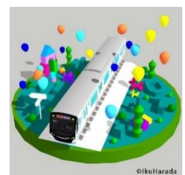
「Dreaming Railways」NFT イメージ

URL: https://www.instagram.com/tokyu_railways/