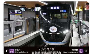
電車カードNFT イメージ