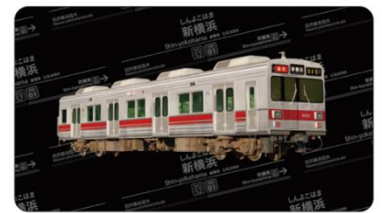
東横線9000系の復刻版NFT イメージ