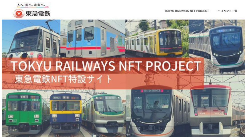
特設サイトイメージ