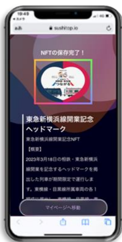
NFT受取画面イメージ