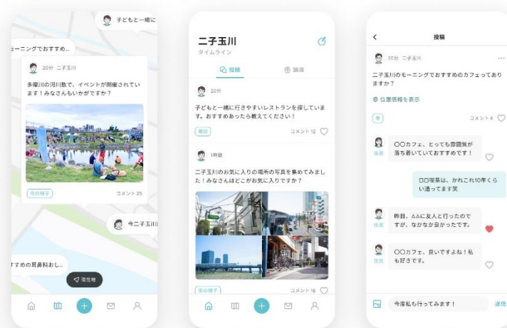
▲「投稿機能」イメージ

身の回りの知りたいことや、疑問などを投稿することで、利用者同士で街の課題を共有することができます。また、コミュニケーションできる範囲を駅を基点とした生活圏単位とし、「同じ街に住む、働く特定多数の人とのコミュニケーション」によって、地域にひも付く課題を解決する共助の関係を後押しします。