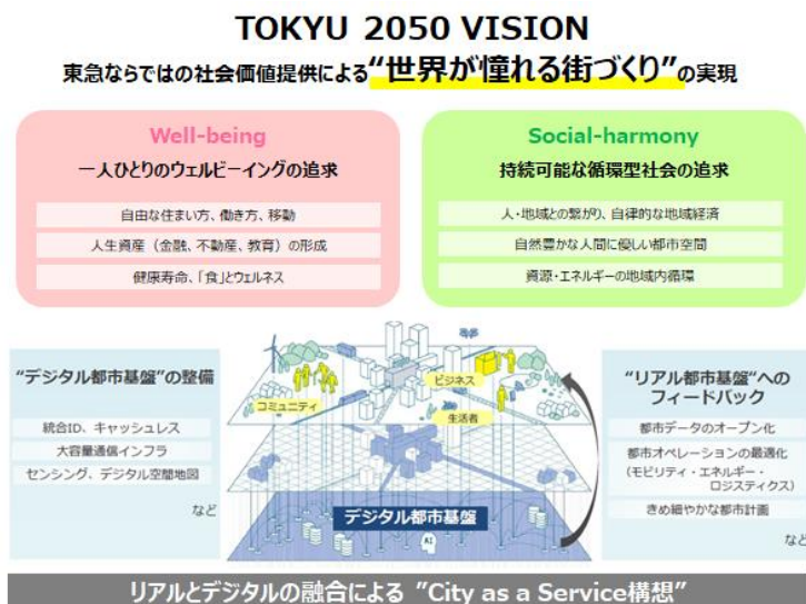
▲TOKYU 2050 VISIONとCaaS 構想