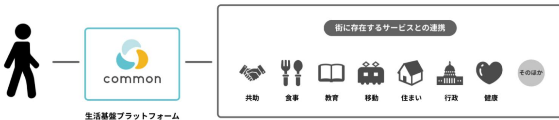
▲地域共助プラットフォームアプリ「common」が目指す姿

新型コロナウイルス感染症の流行が長期化する中で問題となっている社会的な孤独・孤立への対策や、近年増加傾向にある自然災害への防災・減災の観点から、地域コミュニティ・地域住民間の共助の必要性が高まっています。本サービスはこれらを支援するとともに、住民間で不要品を譲り合うことで、脱炭素・循環型社会の実現にも貢献していきます。本サービスは地域共助のプラットフォームサービスとしてスタートしていますが、将来的には、街の中にあるあらゆるサービスとつなげることで、一人一人のライフスタイルに応じた、地域内のさまざまな生活シーンを支える「生活基盤プラットフォーム」となることを目指しています。