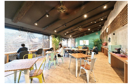
▲コワーキングスペースも充実 (静波リゾートホテル・スウィングビーチ)

働き方改革や新型コロナウイルス感染症の拡大などによりリモートワークが急速に拡大・浸透したことで、全国どこからでも勤務可能なフルリモート勤務制度を導入する企業が増えています。一方、フルリモート勤務制度はあるものの、積極的にワーケーションや全国を巡りながら働くことを奨励している企業は多くない状況です。