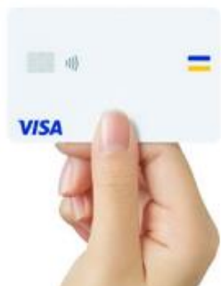
▲タッチ決済可能なVisaカード