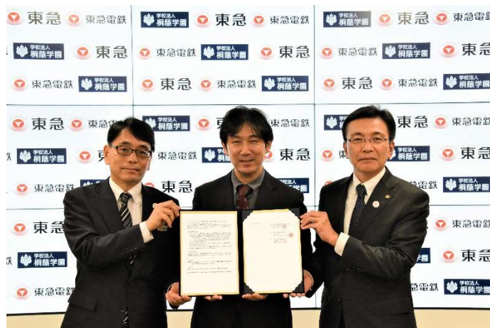
写真左から、東急 鈴置事業部長、桐蔭学園 溝上理事長、東急電鉄 福田社長

三者は各種取り組みを通じて、生活者一人ひとりの自由で豊かな暮らしの実現、社会・環境課題の解決に向け、さまざまな地域の方が参加型で携わる、生活者起点でのまちづくりを推進していきます。