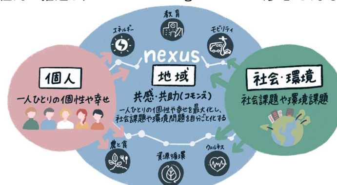
▲nexus構想が目指す姿の概念図

東急とシグマクス・ホールディングスは、今後も多様な領域のバディとの連携を拡大するとともに、各種実証実験や事業化を積極的に推進し、Walkable Neighborhood(歩きたくなるまち)の実現に邁進します。