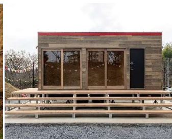
3. nexus Lab