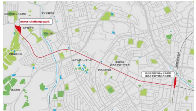
「nexusチャレンジパーク早野」位置図