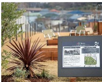
1. Niji Farm

自然の立地をそのままに活用した、生き物のためのエリアです。養蜂や、腐葉土づくりとカブトムシの育成など自然の生態系を学び、楽しむことに加え、たとえば蜂蜜を使った商品づくりなど、様々な「遊び」の循環へもつなげていく空間です。