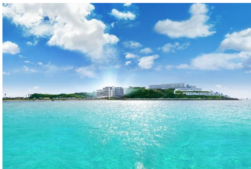
▲海より本物件を望む

東急不動産は、ハイアット リージェンシー 瀬長垣アイランド 沖縄(沖縄県恩納村)、東急ステイ沖縄那覇(沖縄県那覇市)の開発実績に加え、本物件の開発により、沖縄における観光産業の発展、多様化に貢献していきます。