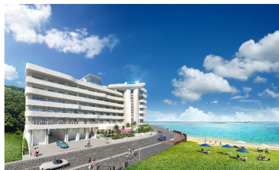
▲本物件外観イメージ