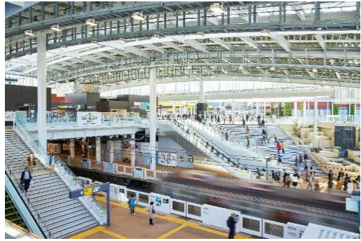
▲田園都市線 南町田グランベリーパーク駅