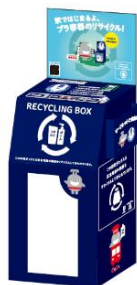
▲回収ボックスイメージ