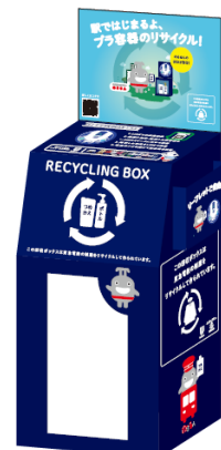
▲回収ボックスイメージ