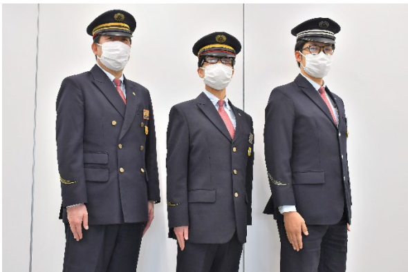
▲活用される東急電鉄制服イメージ

http://www.kadoco.co.jp/rifmo/shikiita.html