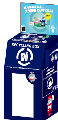
▲回収ボックスイメージ