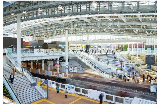
▲田園都市線 南町田グランベリーパーク駅