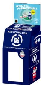
▲回収ボックスイメージ