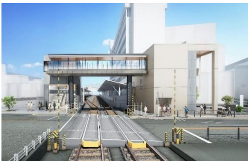
▲奥沢駅全体イメージ