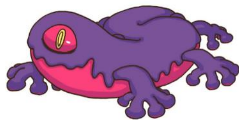
▲オリジナルキャラクター「スキマモリ」