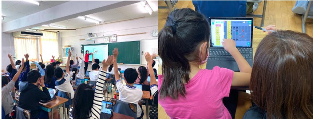
▲左: 渋谷区立猿楽小学校でのサイバーエージェントによるプログラミング授業の様子

各学校の要望に基づき、IT企業や東急グループのスタッフが講師となり、子どもたちへ直接プログラミング学習の授業支援を行いました。授業を受けた子どもたちからは、「身の回りの製品を開発することは難しいと思っていたけれど、自分たちでもそれに近いことができて面白かった」といった声や、家庭科の支援を受けた学級の担任教員からは、「コロナの影響でなかなか調理実習ができなかったので、炊飯器のプログラムを考える活動を通して、炊飯手順の振り返りができたのはよかった」などご好評いただきました。