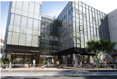
▲the Folks BY IOQ 外観イメージ