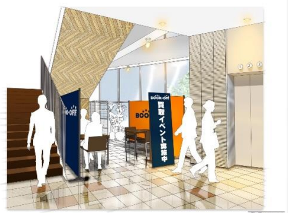
▲不要品買取イベントイメージ