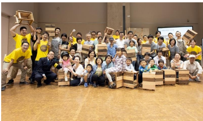
▲椅子制作のワークショップの様子