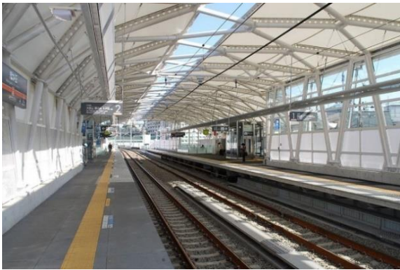
▲大井町線 緑が丘駅