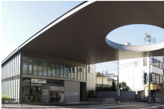
▲大井町線 上野毛駅