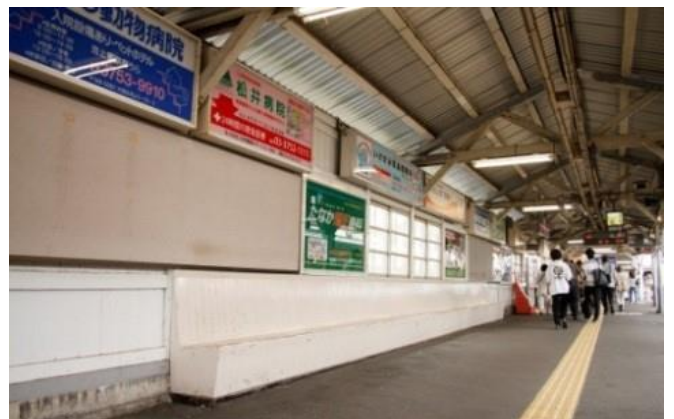
▲旧池上駅に設置されていた長い木製ベンチ