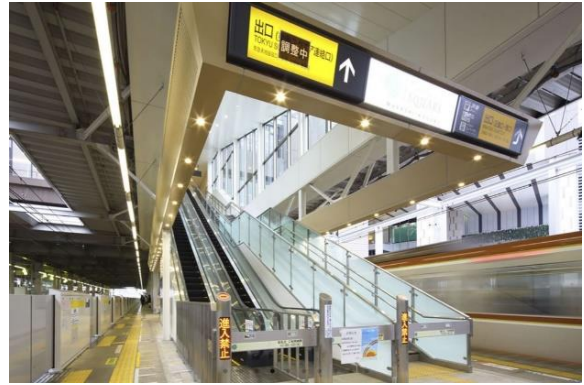
▲東横線・目黒線 武蔵小杉駅