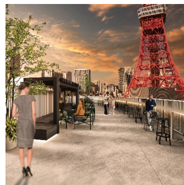
▲ルーフトップイメージ

当社は、今後も資産回転型ビル事業の強化や住宅開発など、社会環境が大きく変化する時代に適応したさまざまな不動産開発を行うことで、東急線沿線の価値向上や新しい価値観の提案など社会的価値の創出による「東急ならではの街づくり」を推進していきます。