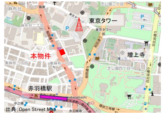
▲GROWTH BY IOQ 位置図