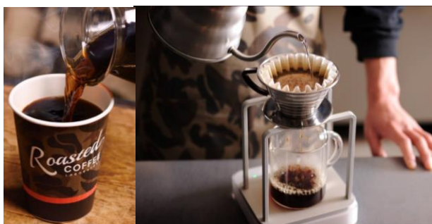
▲「ローステッドコーヒー」イメージ