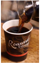
▲ローステッドコーヒー