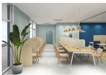
▲ラウンジエリアイメージ