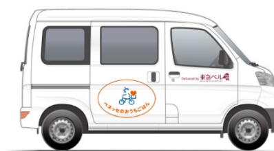
「ベネッセのおうちごはん」の新規エリアにおける配送を受託する東急ベルの配送車およびベルキャストの制服には、「ベネッセのおうちごはん」のロゴと「Delivered by 東急ベル」と表記されます。

東急は今後も、生活を便利で快適にするサービスを拡充し、より豊かな沿線生活の実現をサポートし、沿線地域を活性化させることで「日本一住みたい沿線」を目指します。