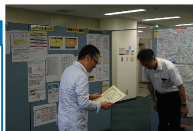
▲「ウォーキング選手権」表彰の様子