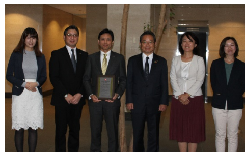
▲健康経営推進賞記念撮影(昨年度)の様子

東急および連結子会社の従業員に対しても健康経営を推進すべきとの観点から、「健康経営推進賞」を実施しています。4回目となる今回は、優秀賞に東急カード株式会社、奨励賞に株式会社東急モールズデベロップメント、東急ジオックス株式会社、東急テクノシステム株式会社、東急スポーツシステム株式会社を選定。オンラインで各社の取り組みを共有し、各社に合った健康経営を検討、推進するきっかけとし、連結子会社も含めた健康経営の機運を高めています。