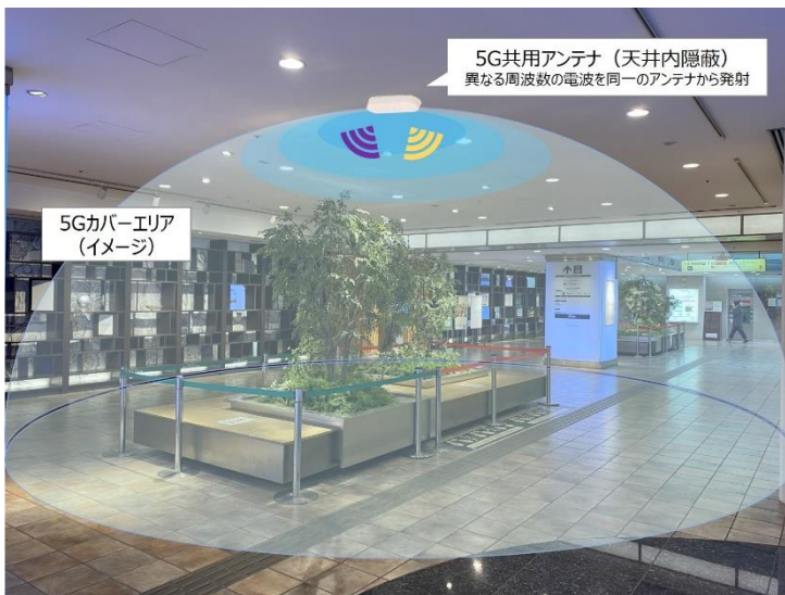
<5G 共用アンテナ・カバーエリアイメージ>