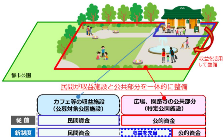
▲Park-PFI 制度のイメージ

2017年の都市公園法改正により創設された、飲食店、売店などの公園利用者の利便の向上に資する公募対象公園施設の設置と、当該施設から生ずる収益を活用してその周辺の園路、広場などの一般の公園利用者が利用できる特定公園施設の整備・改修などを一体的に行う者を、公募により選定する「公募設置管理制度」です。都市公園における民間資金を活用した新たな整備・管理手法として「Park-PFI」(略称:P-PFI)と呼称されています。