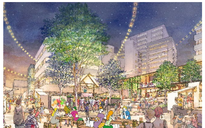
▲オープン後の賑わい創出イメージ※2

北谷公園では、渋谷区の公募により整備事業者として選定された東急を代表企業とする企業コンソーシアムが整備を行い、今般指定管理者に指定された「しぶきたパートナーズ」(URL: https://shibuya-kitaya-park.tokyo/ ) が植栽や公園施設の維持管理を行い、日常的な憩いの場として安全安心な公園環境を提供します。