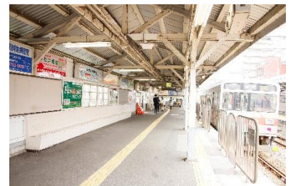
▲旧池上駅で長年親しまれた木製ベンチ

これまでにえきもくを使って椅子、クリスマスオーナメントそれぞれを制作する2回のワークショップ、旧池上駅のえきもくを用いたベンチ制作キットを、公共の場に設置可能な事業者さまへ配布するイベントの計3回の取り組みを実施してきました。第4弾となる今回は新しい駅と駅ビルの各所にえきもくが活用され、お客さまに愛された旧池上駅の記憶を受け継ぎ、お客さまとともに歴史を紡いでいきます。