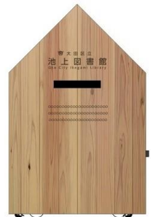
▲えきもくの活用(図書返却ポスト)