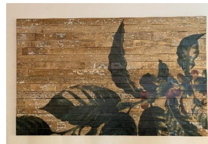
▲スターボックス店内のアートパネル