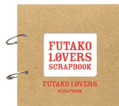
「FUTAKO LOVERS SCRAPBOOK」 ※画像はイメージです。

さらに、スタンプを集めるとプレゼントがもらえるスタンプラリー企画も実施予定です。