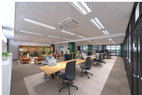
▲2階ワークラウンジイメージ