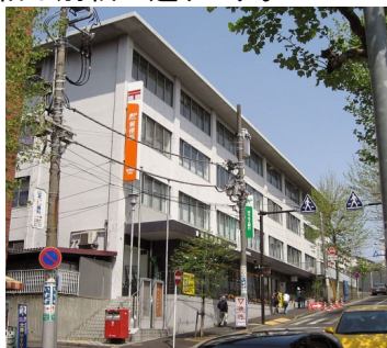
▲青葉台郵便局外観