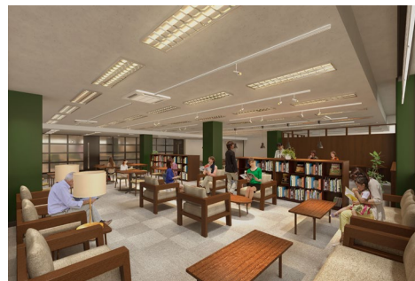
▲2階ブックラウンジイメージ