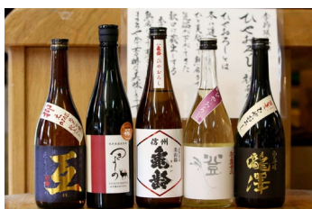
▲上田市ひやおろしオールスターズ

自分が撮影した写真をもとに、農民美術作家がオリジナルの木彫りの人形を手作りします。