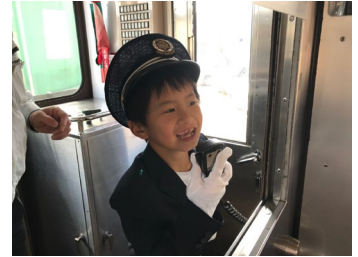
▲車掌体験車内アナウンスの様子