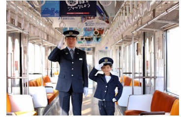
▲貸し切り電車の車内の様子

長野県上田市の上田駅から別所温泉駅までを結ぶ別所線は、のどかな田園風景をゆっくりと走る2両編成の列車。「丸窓電車」が走っていたことで知られ、別所温泉の観光客や地域住民の足として長く愛されてきました。広い空やぼっかり浮かぶ雲を眺めながら走る電車は田園風景をガタゴトとゆっくり走ります。「沿線にいるお子様や地域住民が電車に手を振ってくれるのが見えるとき、とても幸せを感じる」という上田電鉄の運転士。そんな心温まる体験をしてもらえたら忘れられない思い出になるのでは？という思いから開発されました。都会の電車にはないローカル線ならではの魅力を感じながら、お子様との貴重な思い出づくりを、ご家族やご友人、おじいちゃんおばあちゃんも一緒にお楽しみいただきたいです。