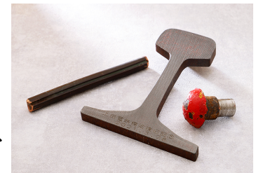
▲鉄橋工事現場とメモリーセットの部品