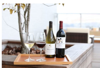
▲巡る匠のワイナリーイメージ