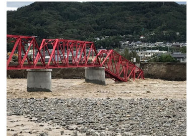
▲崩落した別所線鉄橋

鉄橋復旧には、「崩落した橋の部品が再利用できるか」が大きな鍵となりました。再利用できない場合は莫大な費用がかかる上、見た目にも大きく変わってしまい上田のシンボルが復活したことにはならないためです。調査の結果、上田電鉄の長きにわたるメンテナンスにより、崩落した橋の約80%もの部品が再利用できることがわかりました。残念ながら再利用できなかった部品についても、96年間鉄橋を支えてきた貴重なものとして思いを馳せていただいたい、という気持ちを込めています。