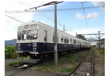
▲下之郷駅車庫線に停車中の丸窓電車

「貸し切り撮影権のおすすめポイントは、好きな位置から好きなカットを心ゆくまで撮影していただけること」と上田電鉄の運転士さん。別所線は鉄道ファンからの人気も高く、運行中も舞田駅や八木沢駅などでカメラを構えている方を多く見ることから、貸し切り撮影権をご用意しました。