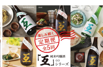
▲互の飲み比べセット～定期便