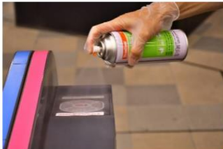
自動改札機への施工イメージ

・シートおよびスプレー吹き付けにより加工を実施・インフルエンザウイルスや細菌（サルモネラなど）、結核菌などに有効