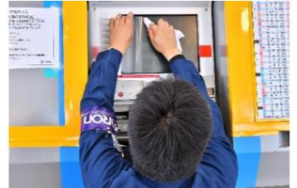
券売機・精算機・チャージ機への施工イメージ