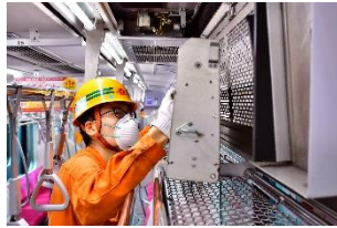
コーティング済みフィルター取付作業