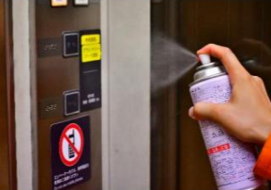
エレベーターへの施工イメージ