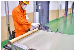
空調フィルターコーティング作業

新型コロナウイルス感染症流行の影響によって、日々の生活にも大きな変化が起きています。みなさまの毎日とともにある鉄道として、もっと安心・快適にお過ごしいただける環境を実現するために、With コロナ時代の新たなスタンダード作りを目指して、私たち東急電鉄が実践している取り組みをご紹介します。