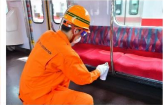
車内抗ウイルス・抗菌加工作業