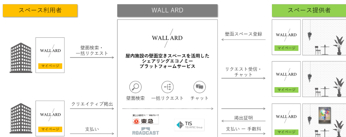
▲WALL ARD サービスの仕組み