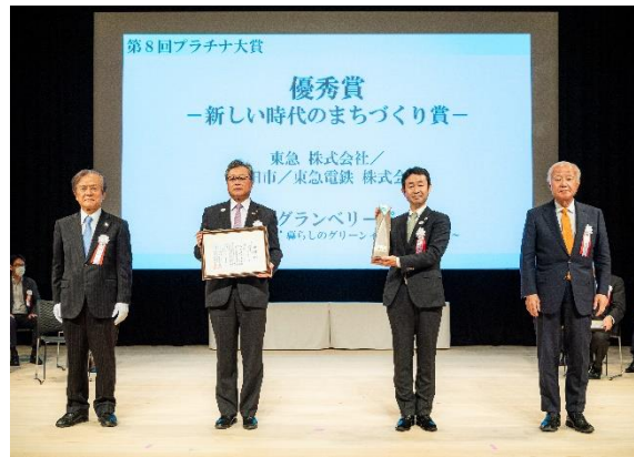
▲プラチナ大賞 授賞式の様子

「南町田グランベリーパーク」は、田園都市線「南町田グランベリーパーク駅」（2019年10月1日に「南町田駅」から改称）南側に広がる鶴間公園と、2017年2月に閉館したグランベリーモール跡地を中心とする約22haのエリアを指し、官民が連携し、都市基盤・商業施設・都市公園・駅などを一体的に再整備・再構築し、自然と賑わいが融合したパークライフを満喫できる「新しい暮らしの拠点」を創り出していくまちづくりプロジェクトが進行しています。