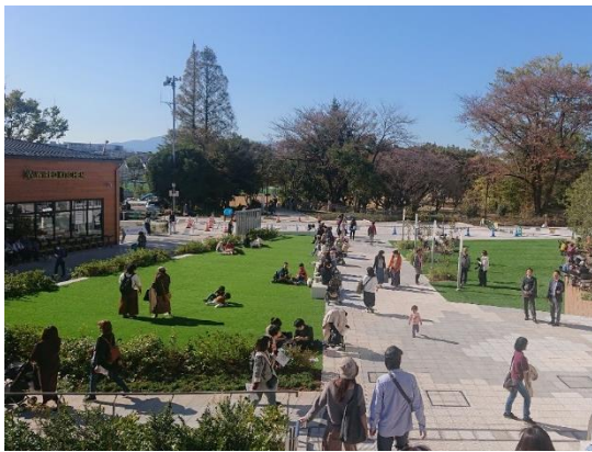
▲まちのオープンスペースとなるプラザ

また、これにより、町田市は、東京都内で2番目となる「プラチナシティ認定自治体」となりました。