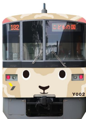
▲ ひつじでんしゃ外観正面