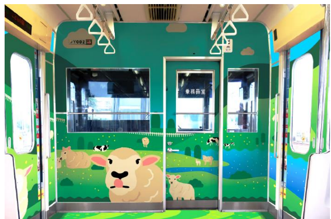
▲ ひつじでんしゃ内装