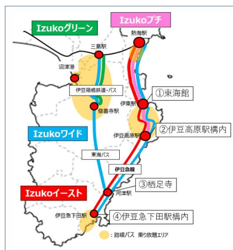
▲デジタルフリーパス対象エリアと「LovePiano」設置場所地図

(デジタルフリーパス540枚、デジタルパス380枚、オンデマンド交通パス300枚、キャッシュレスチケット180枚)