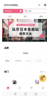
▲仙台空港の専用カウンター（左）と専用ウェブサイト（右）