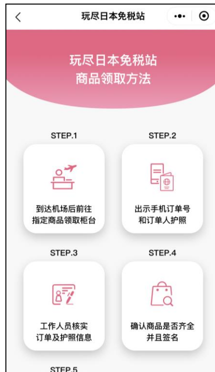
▲商品受け取り方法の説明