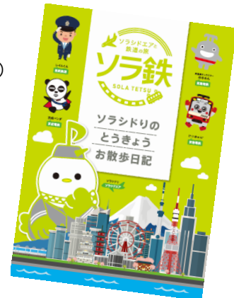
オリジナル台紙表紙