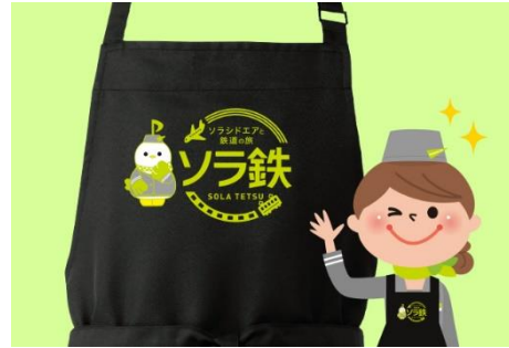
(客室乗務員着用エプロン)