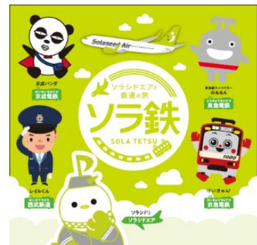
オリジナルヘッドレスト