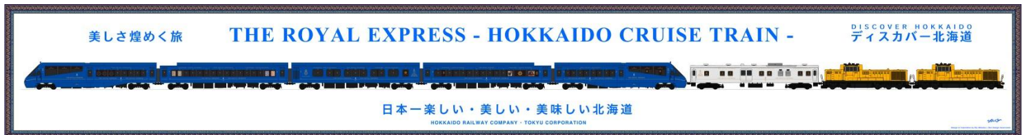
▲列車編成イメージ ©ドーンデザイン研究所