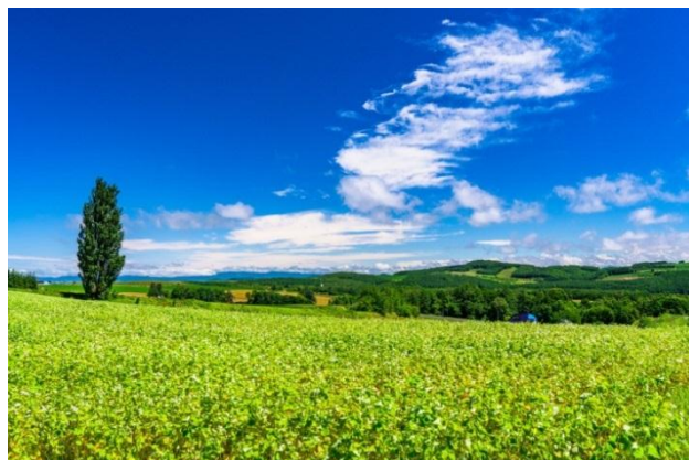
▲旅を彩る北海道の名所、大自然(イメージ)