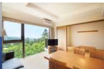
▲「東急バケーションズ伊豆高原」(左)と、東急電鉄人事部門の、同施設でのワーケーショントライアル時(右・2018年12月)