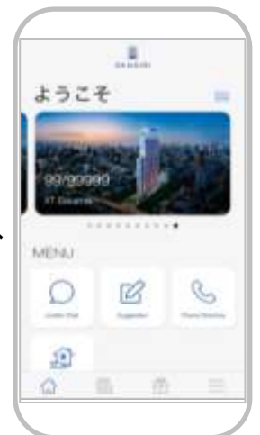
▲「Sansiri Home Service」アプリ画面

サンシリファミリーは、サンシリ社の顧客や物件居住者のための会員制度で、現在の会員数は約7万人です(2018年12月現在)。会員は「Sansiri Home Service」アプリをダウンロードでき、新しい生活プラットフォームとして、管理人へのチャット問合せ、設備・機器の修理依頼や郵便物の預かり状況などが簡単に確認できます。また、このアプリを通して、限定割引やサービスを含む、サンシリ社が厳選した100以上の特典が利用できます。