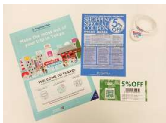
▲WANDER COMPASS PACKAGE