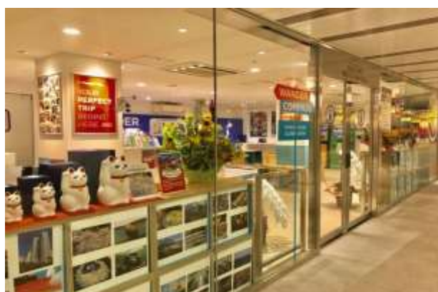
▲WANDER COMPASS SHIBUYA