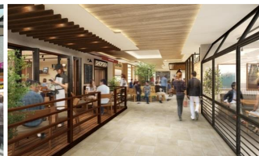
▲第2東急あざみ野ビルイメージ