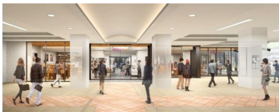
▲あざみ野駅構内イメージ