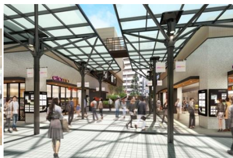
▲東急あざみ野ビルイメージ