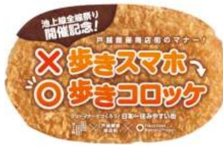
▲歩きコロケカード