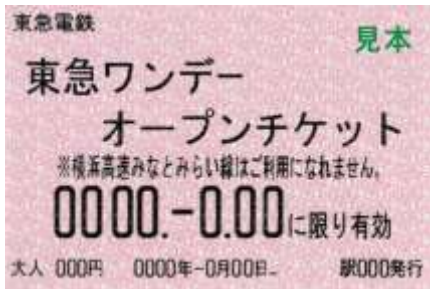
▲東急ワンデーオープンチケット 券面画像

そのほか、池上線沿線の商店街のお店200店以上で、様々な特典を受けることができます。 商店街のお店での特典については、品川区商店街連合会 HP ( https://shoren.shinagawa.or.jp/ )、大田区商店街連合会 HP ( https://otakushoren.com/cp-bin/wp/ )をご参照ください。