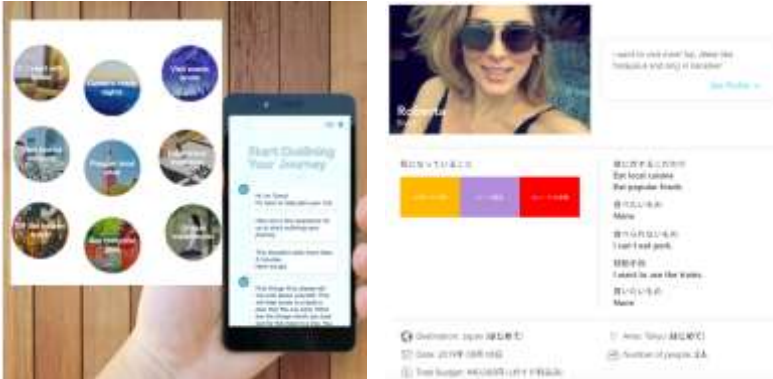
▲たび診断サービスの画面イメージ

また、たび診断サービスから取得できる定量的なデータと実際のガイドから得られる定性的なデータを組み合わせることで、外国人観光客が興味関心のある観光コンテンツの発掘などに向けて活用します。