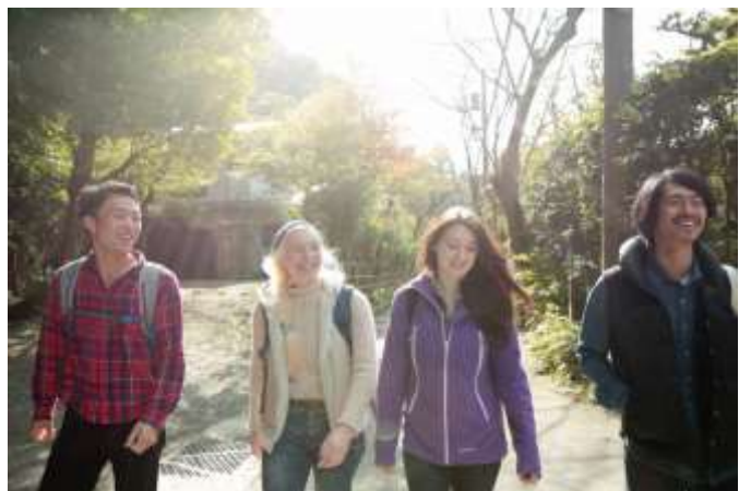
▲ガイドマッチングサービス利用イメージ