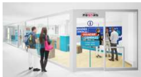
▲WANDER COMPASS SHIBUYA(イメージ)