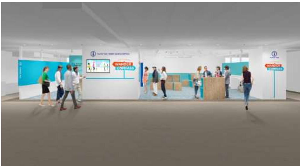
▲WANDER COMPASS KYOTO(イメージ)