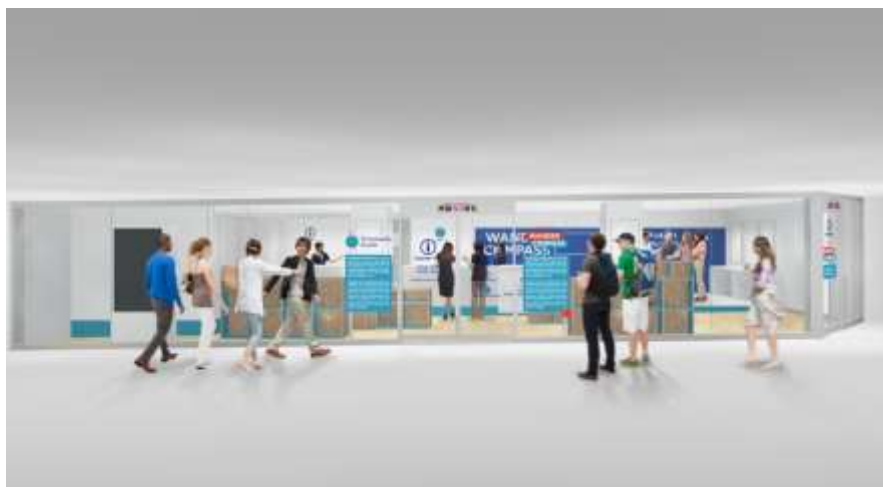
▲WANDER COMPASS SHIBUYA(イメージ)