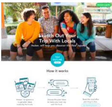
▲ガイドマッチングサービスサイト(イメージ)