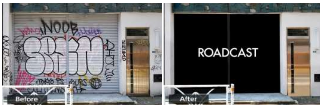
▲ROADCAST 展示 BEFORE イメージ

当社は、今後も本イベントのような企画を通じて、渋谷の情報発信力を高め、いつ訪れても旬な情報に出会えるような、「渋谷ならではの」体験ができる街にすることで、「エンタテインメントシティ SHIBUYA」の実現を目指します。本イベントの詳細は別紙の通りです。