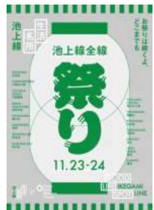
▲本イベントキービジュアル