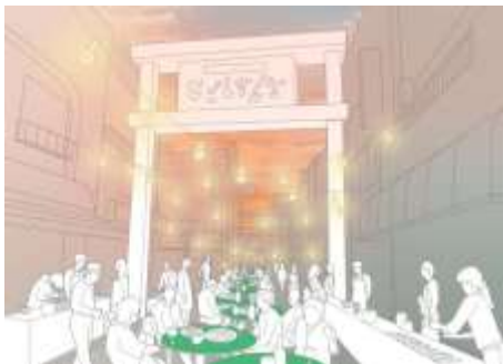
▲戸越銀座駅ストリート・ビュッフェ※画像はイメージです