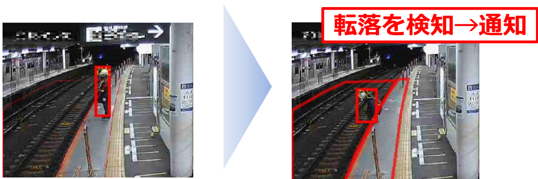
(転落検知支援システムの仕組み)